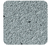
grau granitsplitt sandgestrahlt