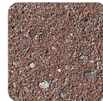
braun leicht sandgestrahlt