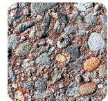
braun stark sandgestrahlt