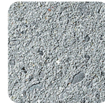
grau leicht sandgestrahlt