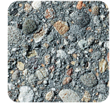
anthrazit stark sandgestrahlt