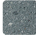
anthrazit leicht sandgestrahlt