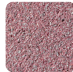
bordeauxrot granitsplitt sandgestrahlt