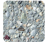
grau stark sandgestrahlt